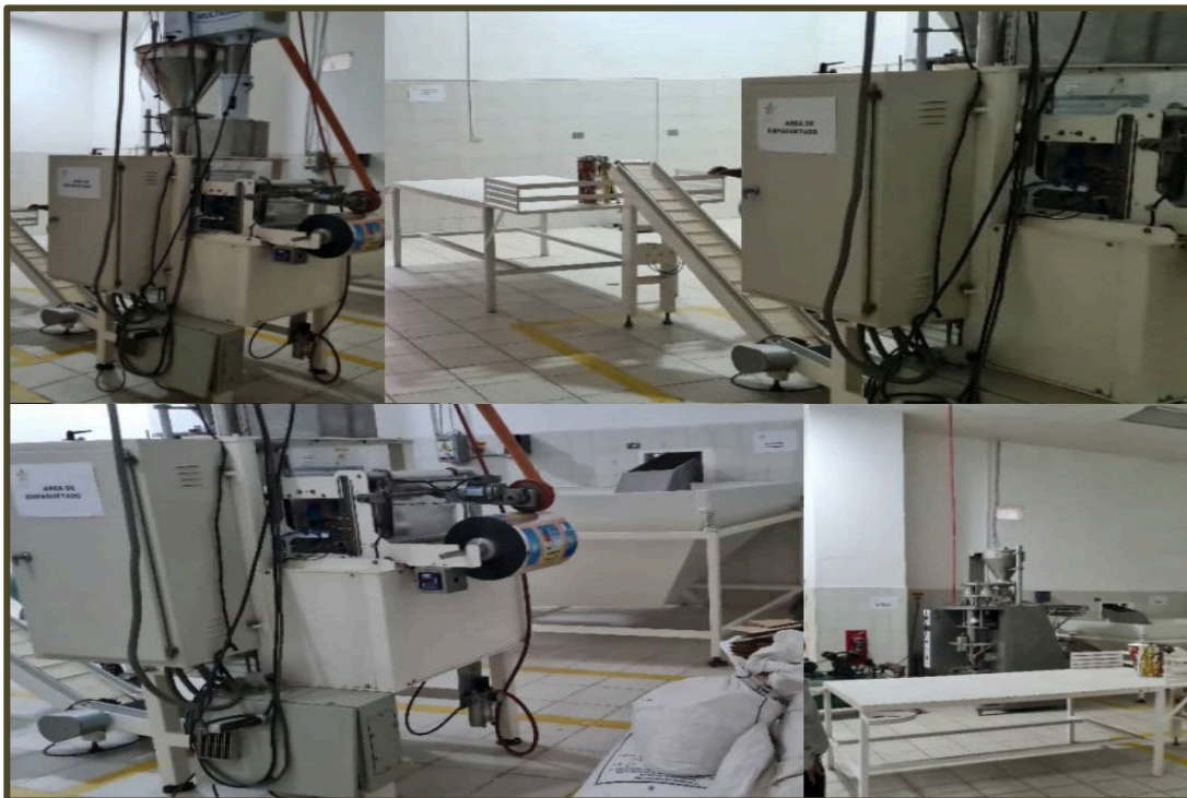
Área de Empaquetado

Requiere de apalancamiento para adquisición de equipos como una Tostadora de Cacao y Refinadora de Chocolate para poder desarrollar más productos y expandir su oferta, desarrollar aún más su emprendimiento y poder además apoyar a otros emprendedores del Estado Carabobo que así lo requieran.